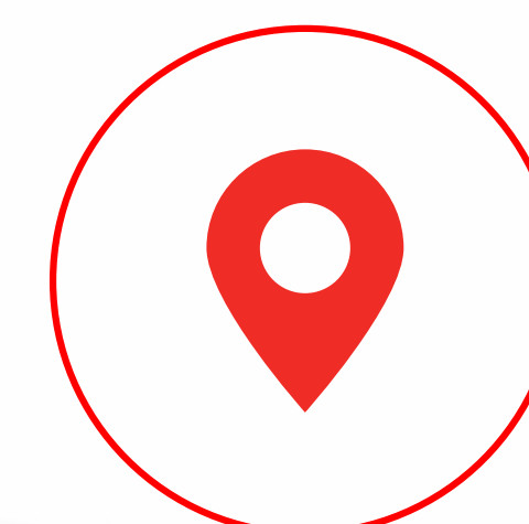
Sucursales en todo el país