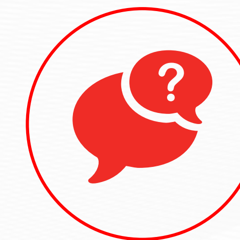
Atención en línea