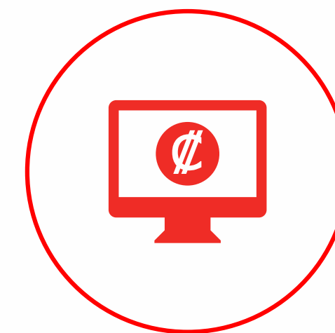
Banca en línea www.davivienda.cr