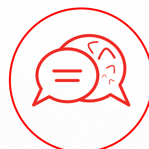
Asistente en línea