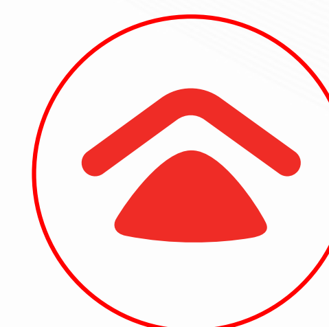
Teléfono rojo 2287-1111