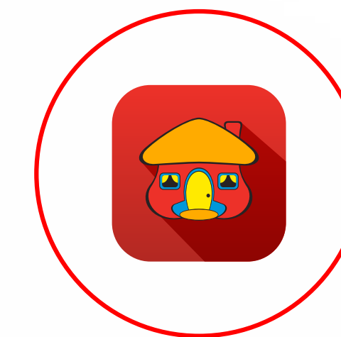
App davivienda costa rica